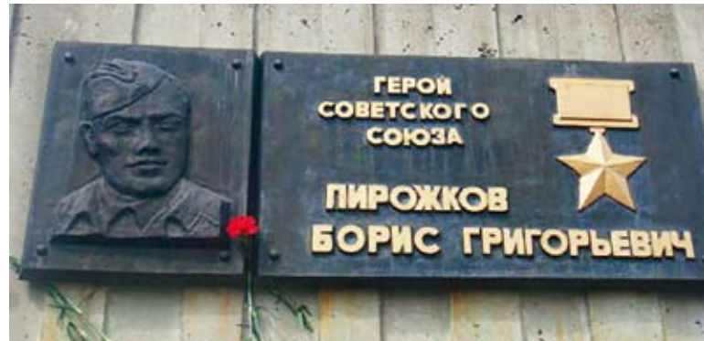
Борис Пирожков первым провёл успешный воздушный бой на высоте 10 000 метров.

А 4 сентября 1942 года в небе недалеко от Тулы наш земляк совершил воздушный таран. Рухнул на землю вместе со сби-