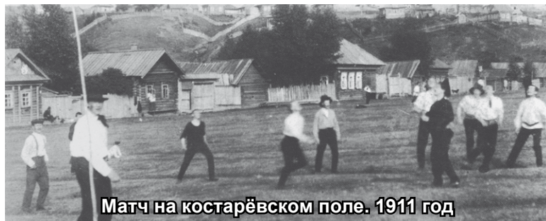
Матч на костарёвском поле. 1911 год

Экипировка первых футболистов сейчас бы вызвала умиление. Чего только стоили бутсы! Вообще-то, это были обычные армейские ботинки, только особым образом перекроенные (согласно представ-