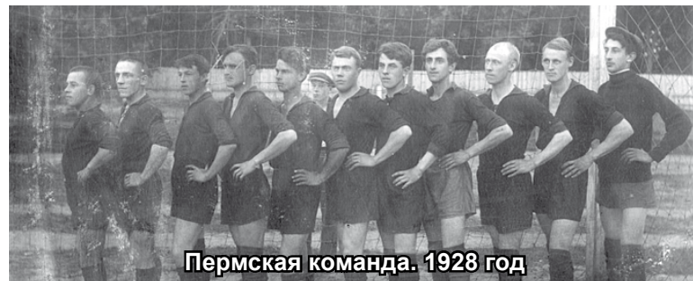
Пермская команда. 1928 год

В двадцатые годы, несмотря на голод и нужду, футбол в Мотовилихе жил и развивался. Любители футбола так увлекались перипетиями матчей, что за-