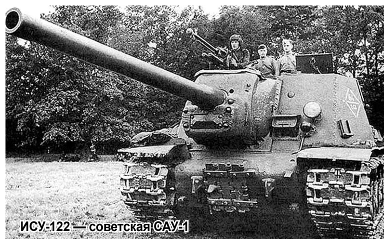
ИСУ-122 — советская САУ-1